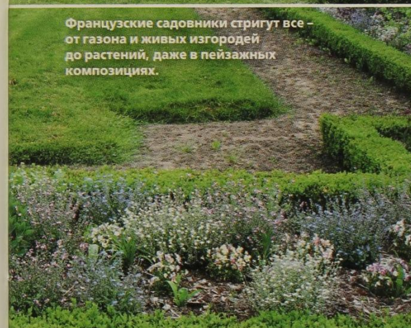
Французские садовники стригут все – от газона и живых изгородей до растений, даже в пейзажных композициях.