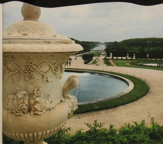
Версаль. Зеркало воды и удаляющиеся в бескрайнюю даль зеленые стены боскетов.