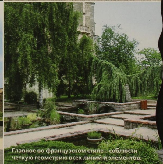
Главное во французском стиле – sobлюсти четкую геометрию всех линий и элементов.