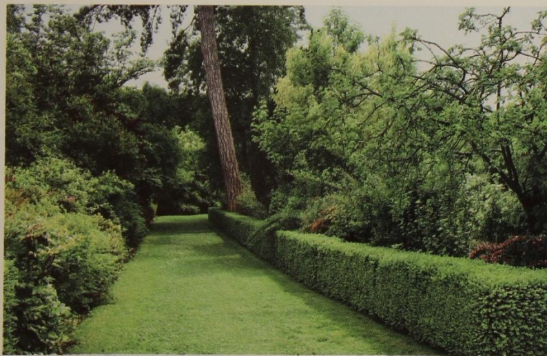
Несмотря на регулярность линий, картина выглядит очень естественно. Строгая живая изгородь только подчеркивает красоту пейзажных посадок.

Главная особенность композиции Версальского парка – грандиозность общей перспективы, центральная ось которой уходит в бесконечные дали, символизируя безграничную власть короля. Многообразие и тщательная проработка деталей, с одной стороны, целостность и единство всей композиции, подчиненная общему архитектурному замыслу, с другой, позволили создать выдающийся шедевр французского классицизма, основанный на принципах, которые Ленотр последовательно проводит и в других своих произведениях: регулярность, строгость, симметрия и ясность композиции.