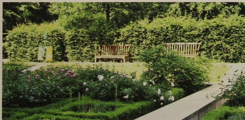
Регулярный «утопленный» цветник – излюбленный мотив французских садов.