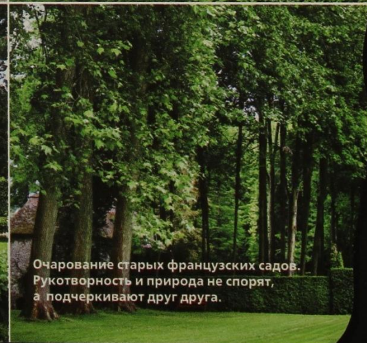
Очарование старых французских садов. Рукотворность и природа не спорят, а подчеркивают друг друга.