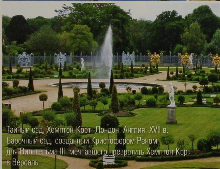
Тайный сад, Хемптон-Корт, Лондон, Англия, XVII в. Барочный сад, созданный Кристофером Реном для Вильгельма III, мечтавшего превратить Хемптон-Корт в Версаль