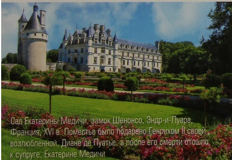
Сад Екатерины Медичи, замок Шенонсо, Эндр-и-Луара, Франция, XVI в. Поместье было подарено Генрихом II своей возлюбленной, Диане де Пуатье, а после его смерти отошло к супруге, Екатерине Медичи

связана со зданием виллы. Известным мастером садового искусства в Италии был архитектор Джакомо да Виньола (1507–1573), построивший к северу от Рима лучшие виллы Ренессанса – Капрарола и Ланте. Другой архитектор, Пирро Лигорио (1514–1583), создал одну из самых знаменитых итальянских вилл позднего Возрождения – виллу д'Эсте в Тиволи. Она поражает обилием фонтанов, каскадов и бассейнов, работающих под естественным напором воды, устроенных с размахом и театральным эффектом (аллея ста фонтанов, фонтан органа, «кипящая лестница», фонтан дракона). Французские сады барокко, в отличие от итальянских садов Ренессанса, не столь динамичны, однако поражают грандиозными масштабами. Они отличаются сложностью пространственного построения, декоративностью, большим количеством водных устройств и скульптур.