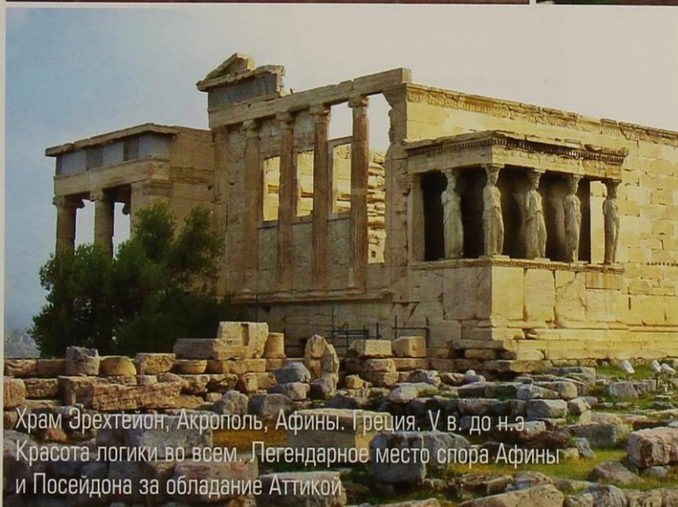
Храм Эрехтейон, Акрополь, Афины. Греция. V в. до н.э. Красота логики во всем. Легендарное место спора Афины и Посейдона за обладание Аттикой