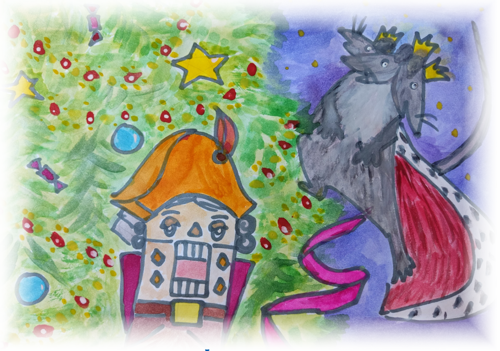
ГЕОРГИЙ КИРПИЧЕВ, 10 ЛЕТ. Э. Гофман «Щелкунчик и мышиный король»