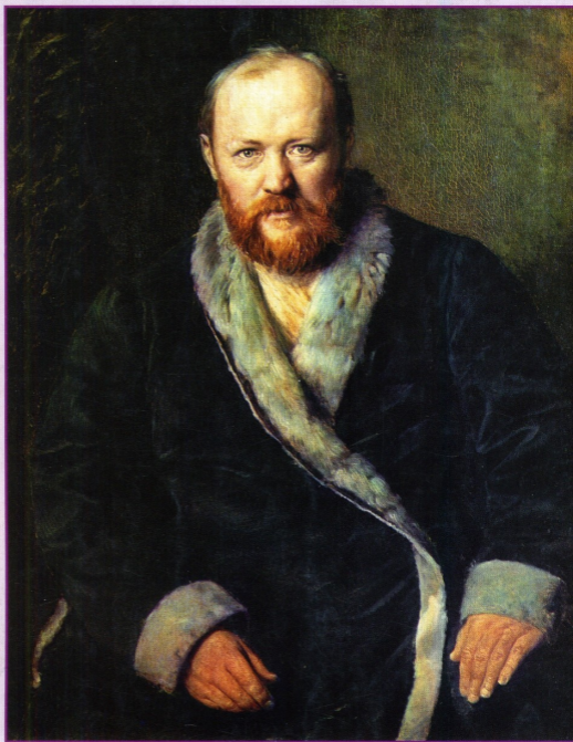
В.Г.Перов. Портрет драматурга Александра Островского. 1871

Научно-методический журнал. Основан в августе 1914 года