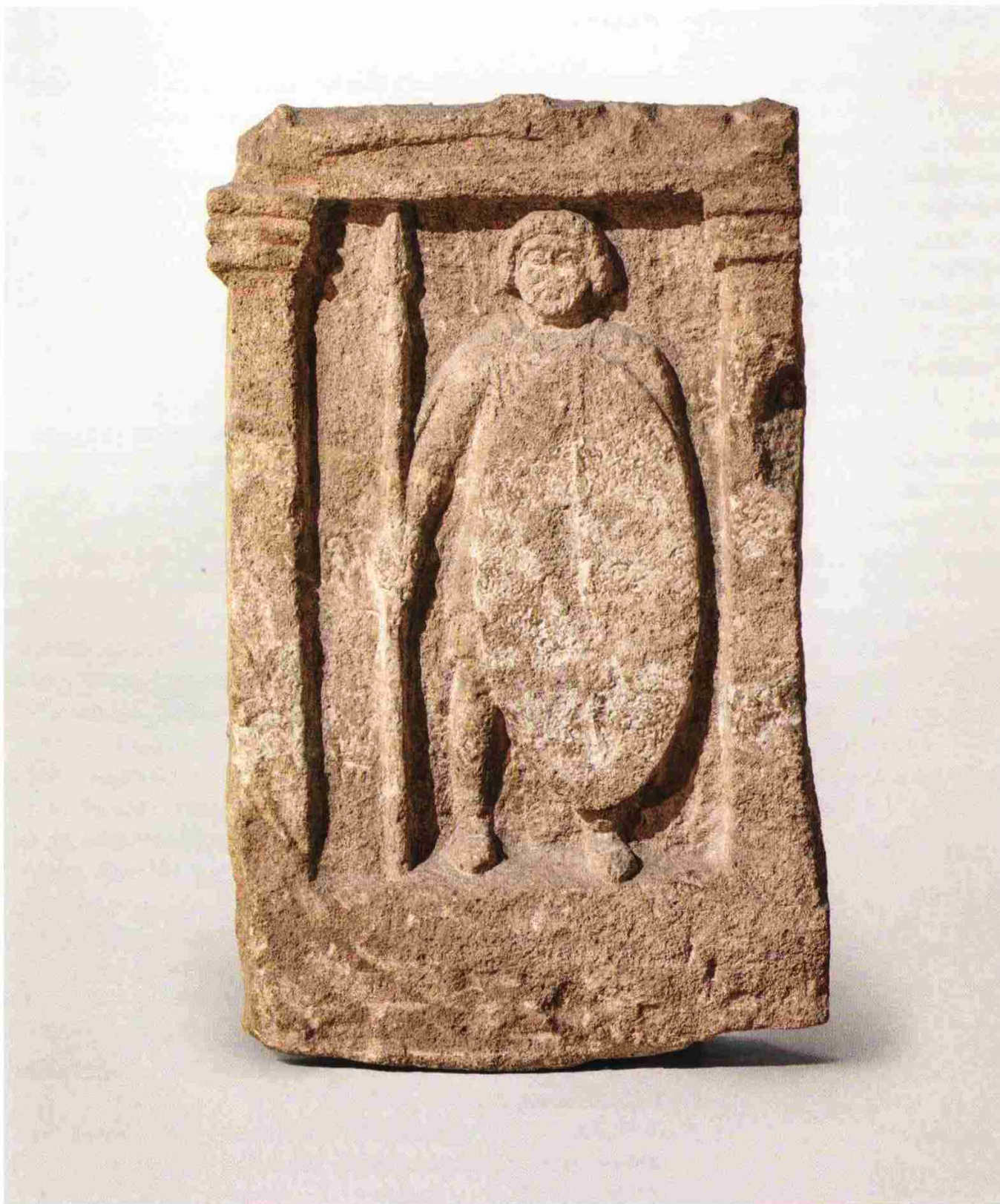
1. Надгробие воина со щитом. Боспор. Конец II – начало I века до н.э. Известняк