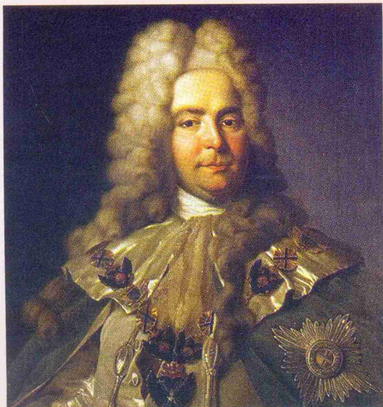
Павел Иванович ЯГУЖИНСКИЙ, первый генерал-прокурор (1683–1736)