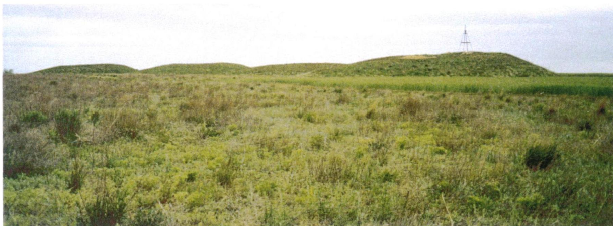
Курганы сарматской знати на водоразделе Ори и Большого Кумака. Новоорский район, V–IV вв. до н. э.