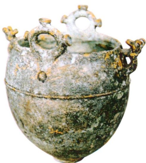
Бронзовый котёл сарматской культуры. Найден в погребении у села Мухраново в Илекском районе

В I тысячелетии до нашей эры на смену ариям, переселившимся на Балканские острова, пришли скотоводческие племена, именуемые савроматами, позже — сарматами. В своей «Истории», написанной в конце 40-х — начале 30-х годов V века до н. э., знаменитый греческий учёный и путешественник Геродот повествует о прикаспийских равнинах, сменяющихся «каменным и неровным» Общим Сыртом и Приуральем, за которыми стоят «высокие» Уральские горы. В этом описании угадывается наша оренбургская территория, где с VI века до н. э. по IV век н. э. как раз и проживали савроматы-сарматы. О длительном периоде обитания сарматских племён в южноуральских степях напоминают их многочисленные могильные памятники в виде различной величины курганов, по-местному называемых «марами» или «шиханами». Они представляют собой земляные насыпи высотой до 5–7 метров. Раскопки