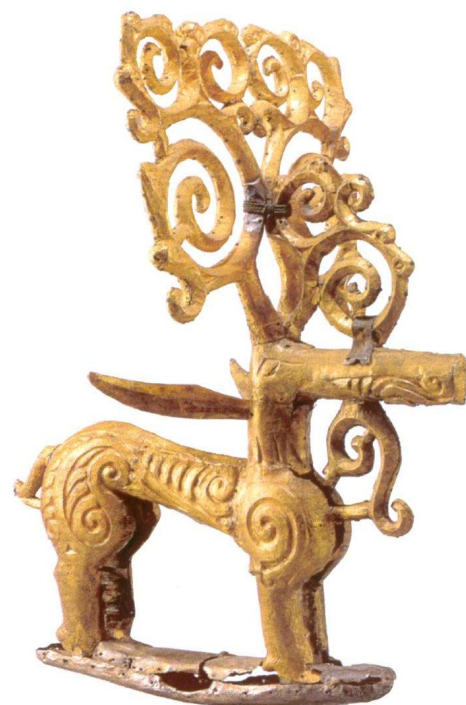
Фигурка оленя, вырезанная из дерева и обтянутая тонким листом из металла. Высота около 50 см. Найдена в самом большом — «царском» кургане Филипповского могильника. Илекский район

В последующий временной период в южноуральских степях господствовали племена венгров и печенегов, гузов и кипчаков, получившие название поздних кочевников. Свидетельством их пребывания на территории современной Оренбургской области являются могильные памятники. Как и ранние кочевники, они верили в загробную жизнь и потому клали в могилу оружие, различные вещи, случалось — и любимого коня. Погребения поздних кочевников обнаружены у села Нежинка Оренбургского района, вблизи города Соль-Илецка, у посёлка Новый Кумак Новоорского района... В погребениях найдены остатки одежды