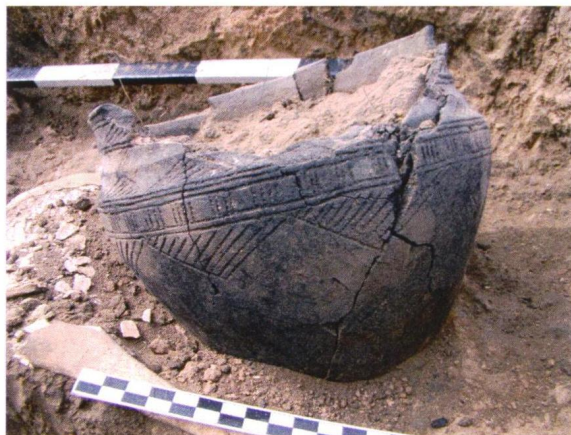
Сосуд срубной культуры в одном из курганов у с. Боголюбовка Новосергиевского района

В эпоху бронзы на востоке нынешней Оренбургской области проживали арии, говорившие на одном из диалектов древнеиранского языка. Они разводили скот, занимались рыболовством, охотой и примитивным земледелием. Их руками строились укрепленные поселения, добывалась медная руда, изготавливались бронзовые орудия труда, оружие и украшения.