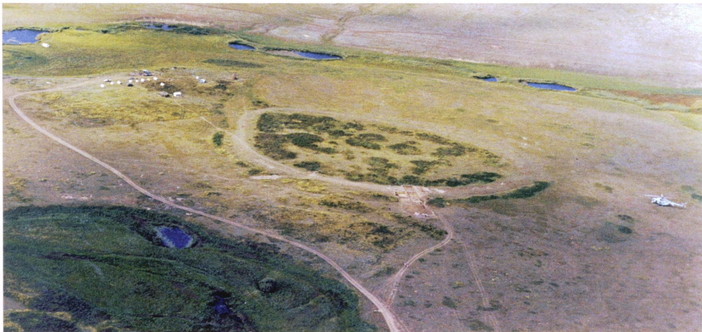
Городище Аландское в Кваркенском районе. В древности оно было окружено валом, обложенным каменными плитами, на валу возвышались стены, перед которыми находился глубокий ров с водой. Темные пятна более высокой растительности указывают, где располагались жилища

Первопришельцы, в поисках новых охотничьих угодий добравшиеся из пределов Южного Казахстана и Средней Азии в степные южноуральские просторы, были людьми современного физического типа. Они жили матриархальными общинами, в которых главой рода считалась женщина. Их главным хозяйственным занятием являлась охота на диких зверей. Охотники были вооружены копьями с каменными наконечниками, костью гарпунами, кремнёвыми ножами, костью и каменными кинжалами, деревянными палицами. Они одевались в звериные шкуры, жили в пещерах и землянках, умели добывать огонь. Об их пребывании на территории нынешней Оренбургской области свидетельствуют обнаруженные археологами их стоянки в низовьях реки Бузулук на севере Курманаевского района и в предместьях города Медногорска, найденные в Матвеевском районе кремнёвые орудия, «Донгузская плита» с изображением оленя на Илекском плато... С древнейшими находками палеолитического облика тех времён (топоры, молотки, ножи, наконечники стрел...) можно ознакомиться в областном краеведческом музее.