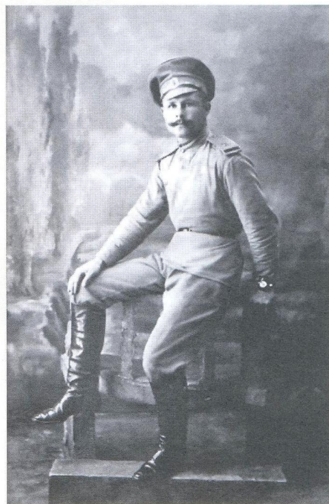
Казак 2-го Оренбургского казачьего полка