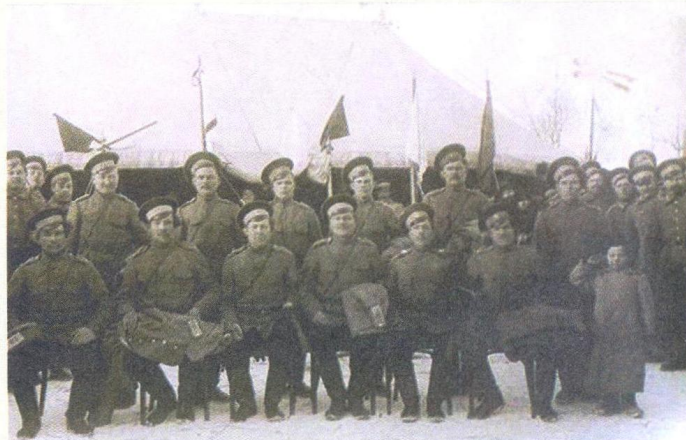
Казаки Оренбургского казачьего войска 2-го полка.