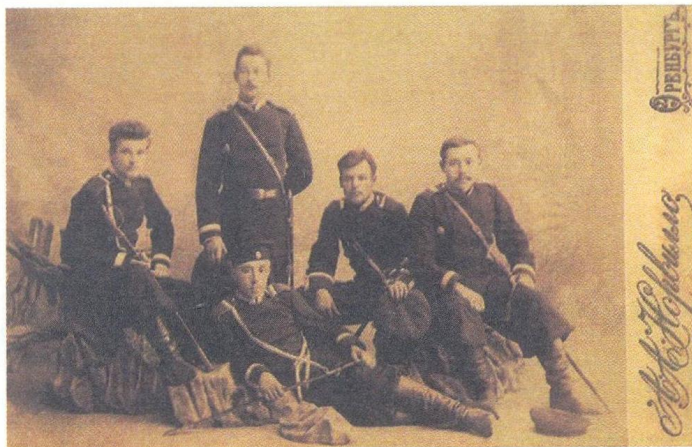
Оренбургские казаки.