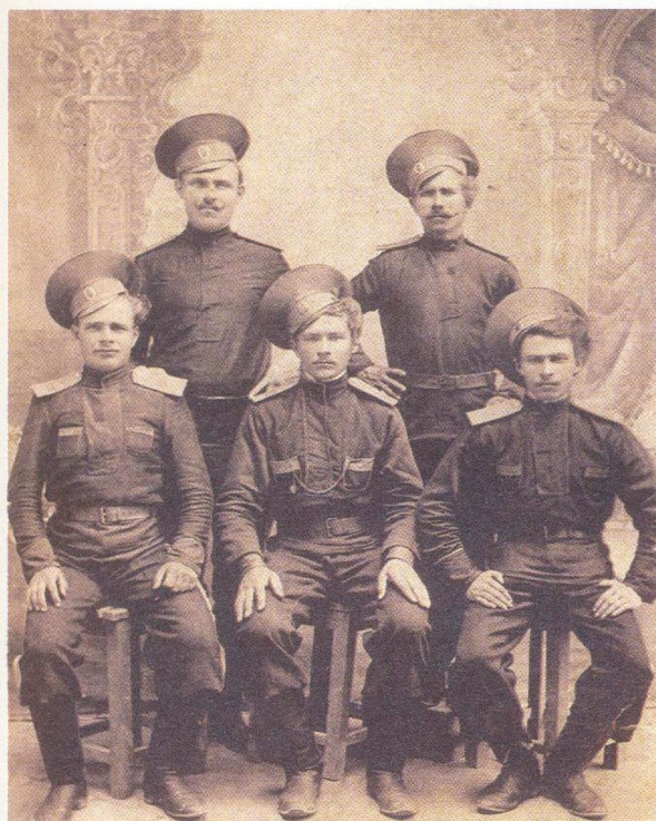
Казаки Оренбургского казачьего войска 6-го полка.