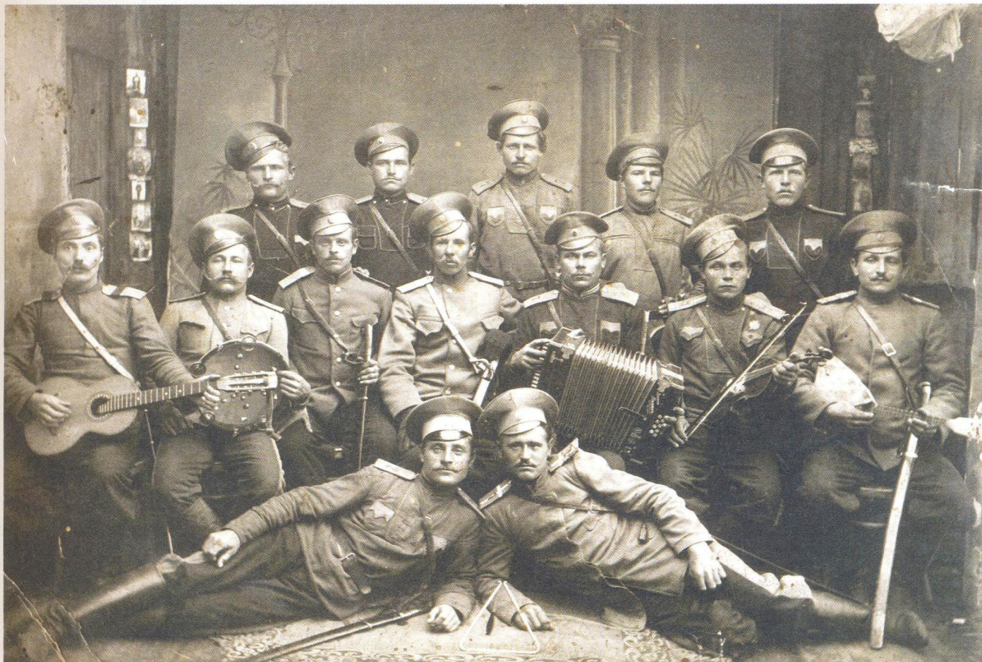
Оренбургские казаки – участники Первой мировой войны. 1914 г.