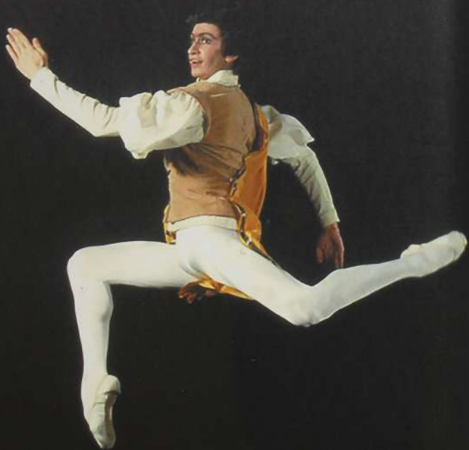
Фото А. Брозжниковой

Меркуцио. Балет «Ромео и Джульетта» Ю. Н. Григоровича.