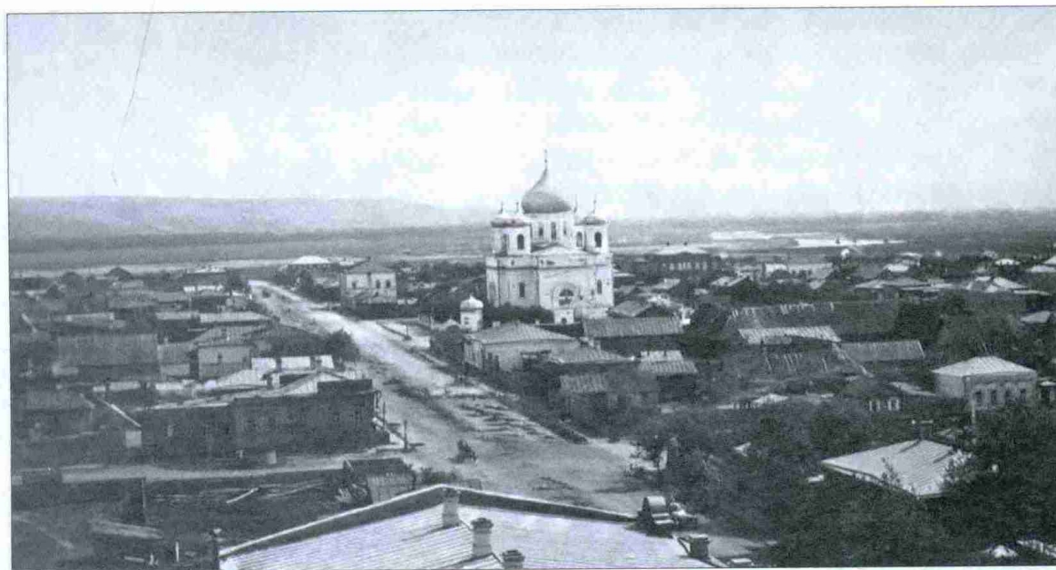
Фото из фондов Бузулукского краеведческого музея

Окрестности нынешнего города Бузулука и местность, им занимаемая, носят очевидные следы весьма давних поселений. В иных местах встречаются остатки валов и рвов, в других попадаются кирпичи уничтоженных зданий. Народные рассказы утверждают, что здесь существовал татарский город, в котором жил Аулган-Хан. В прошедшем столетии ещё были здесь развалины кирпичных мечетей и других зданий, совершенно разорённые первыми поселенцами Бузулука, выбравшими кирпич на свои постройки.