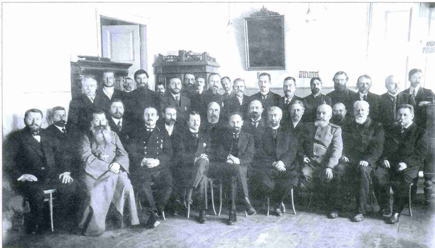
Бузулуцкое уездное земское собрание, 1913 год

В ведении земской управы были вопросы уездного образования и медицины, страховое, статистическое и почтовое ведомства. Земство облагало жителей уезда сборами и повинностями и на полученные средства открывало школы, больницы и фельдшерские пункты, строило дороги и мосты; нанимало на службу различных специалистов — медиков, учителей, статистиков, агрономов, строителей; занималось благотворительностью.