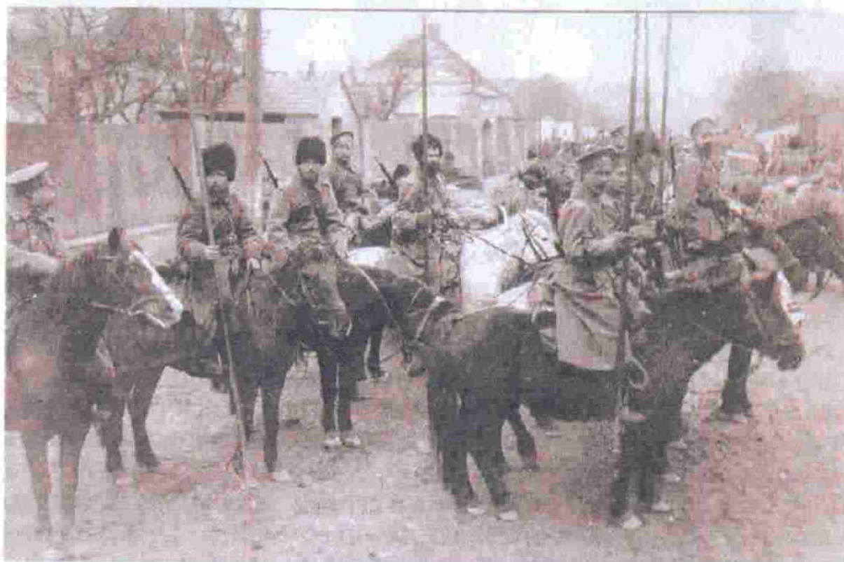
Казачи в Польше, октябрь 1914 г.

Но за год-полтора после большого провала 1915 г., произошел в России огромный экономический и военный прорыв.