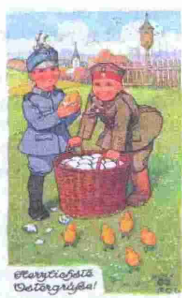
Российские и германские пасхальные открытки времён Первой мировой войны. Интернет-ресурсы. https://imtw.ru/topic/63952-agitaciya-i-propaganda-pervoi-mirovoi-voiny/page__st__10__p__2557683

В Страстной Четверг утром из неприятельских окопов вышел офицер с двумя солдатами: все были без оружия, несли белый флаг <...> Всякая стрельба, как с нашей стороны, так и со стороны противника, совершенно прекратилась в 6 часов вечера в Страстной Четверг <...> В Страстную Субботу мой полк был сменён казаками. Несомненно, эскадроны передали казачьим сотням о состоявшемся «перемирии». При следующей смене казаки рассказывали, что в первый день Пасхи