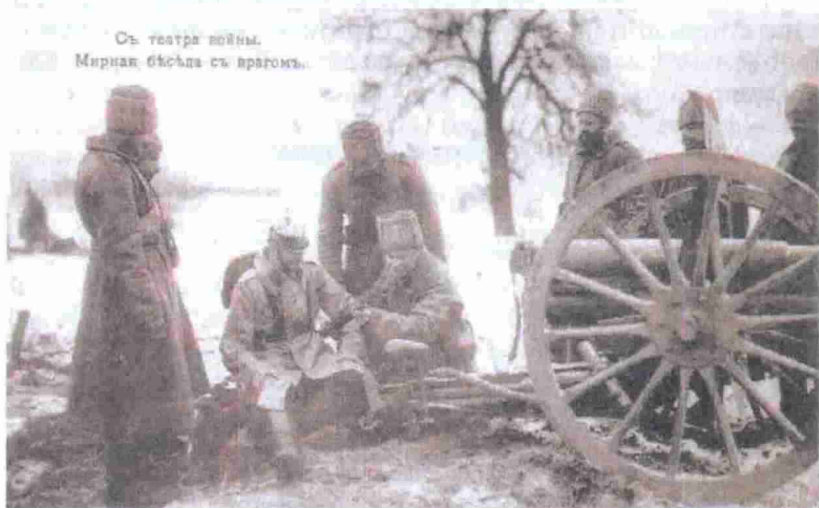
Казаки в Польше, октябрь 1914 г.

из окопов противника вышла группа австрийцев, которые вместо оружия несли в руках бутылки. Заметив это, казаки взяли «пасху», колбасы, сала и пошли на встречу неприятеля, где и произошло совместное разговение. Затем появился казак с гармошкой, а у австрийцев нашёлся скрипач. Начались танцы, куда стекалась громадная толпа солдат с обеих сторон. Офицеры смотрели на совместное празднование двух враждующих армий, но этому не препятствовали. Даже один командир казачьей сотни пошёл в толпу и поздравил австрийского капитана с Пасхой. В 6 часов вечера, на третий день Пасхи, с обеих сторон завизжали артиллерийские снаряды и засвистели пули. Только что бывшие друзья сразу сделались врагами, готовые один другого заколоть штыком...» 1 .