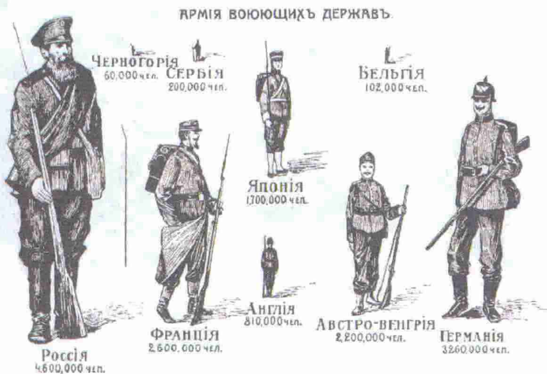
Армии воюющих держав. Интернет-ресурсы

Положение России было не хуже других стран-участниц войны. Прежде всего, у всех, кроме России, были исчерпаны людские ресурсы для пополнения армий. Тяжелее всего было Германии и Австрии, лозунг немцев — «продержаться». Сам Людендорф с болью в сердце признавал, что положение страны к началу 1917 года было почти безысходным 2 , что уж говорить про слабую Австро-Венгрию. Россия же к 1917 г. достигла пика своей силы. Население, промышленное и иное производство, общественная жизнь, демократия де факто — к любой почти области жизни можно было применить прилагательные типа — огромная, сильная, мощная. Проблемы немалые тоже были, ведь «война — дорогое удовольствие».