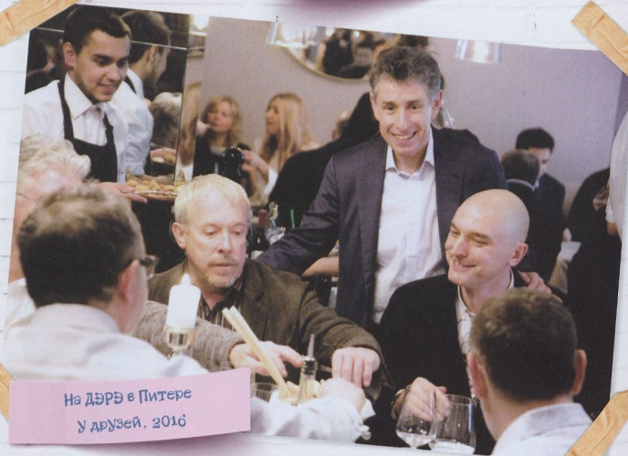
На дээр в Питере У друзей, 2016