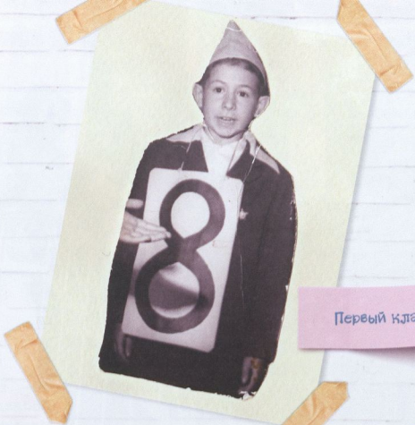
Первый класс. 1962