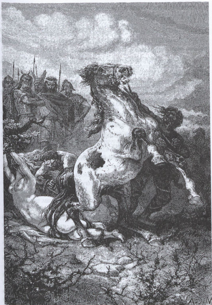
Макбет убил отважную госпожу и всех, кто ее окружал