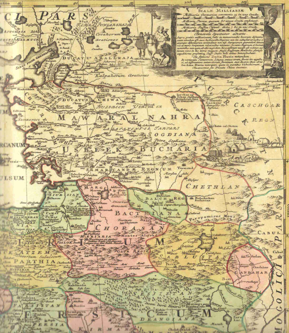
1. Карта Персидской Империи Иоганна Баптиста Хоманна (ок. 1730 г.) 1. The map of the Persian Empire by Johann Baptist Homann (app. 1730)

THE IN SISTENT petitions of the nomadic Kirghis-Kaisak tribes, who inhabited this locality and wished to become subjects of the Russian crown, are believed to have triggered development in the territory that now is known as Orenburg oblast.