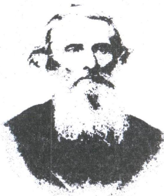
В.И. Даль. Фотография. Москва. 1860-е гг.

До наших дней сохранился главный деревянный дом московской усадьбы, принадлежавшей лексикографу, писателю, этнографу В.И. Далю. Усадьба располагалась на углу улиц Кудринской (сейчас Баррикадной) и Большой Грузинской. В доме на Пресне В.И. Даль жил и работал с 1859 г. по 1872 г. Здесь он завершил и издал труд всей своей жизни – «Толковый словарь живого великорусского языка». После смерти лексикографа его дом москвичи стали называть «Домом Даля».