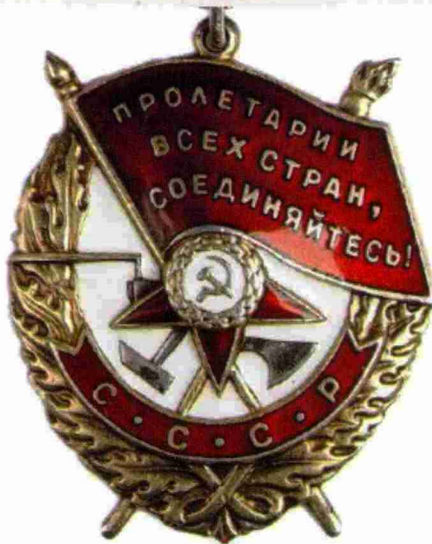
1944 год. Орден Красного Знамени

Успешно действовала в 1944 году в наступательных операциях по освобождению Правобережной Украины. За образцовое выполнение заданий командования при прорыве сильно укрепленной немецкой обороны и освобождении города Новый Буг была удостоена почетного наименования Новобугская и награждена орденом Красного Знамени. Приказ Верховного Главнокомандующего № 063 от 19 марта 1944 года.