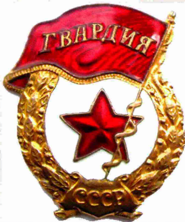
1942 год - бригаде присвоено звание «Гвардейская»

9 августа 1942 года, выйдя маршем к станции Селижарово,