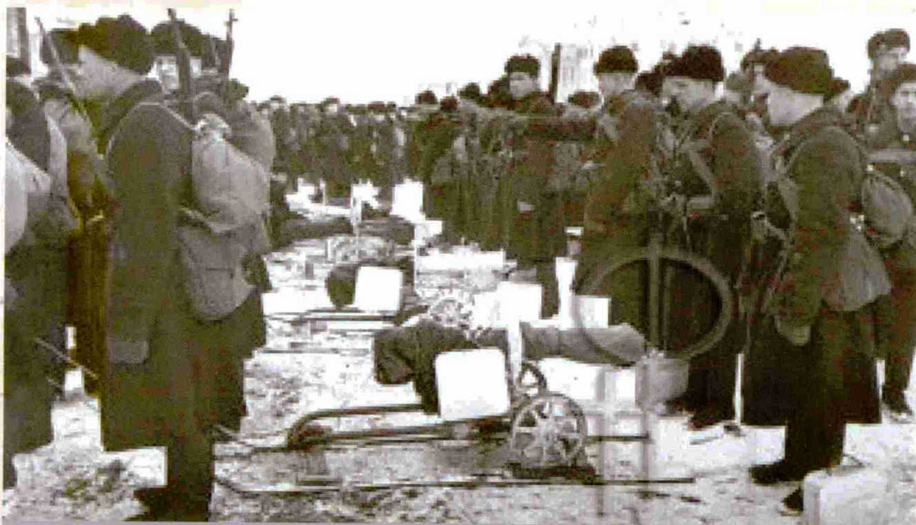
Воины 75-й отдельной морской бригады перед битвой под Москвой, 1941 год

17 января 1942 года бригада из района Нахабино переброшена железной дорогой на станцию Бологое, откуда непрерывными маршами вышла в район Слобода (15-20 км юго-восточнее города Старая Русса) и впервые вступила в соприкосновение с противником.