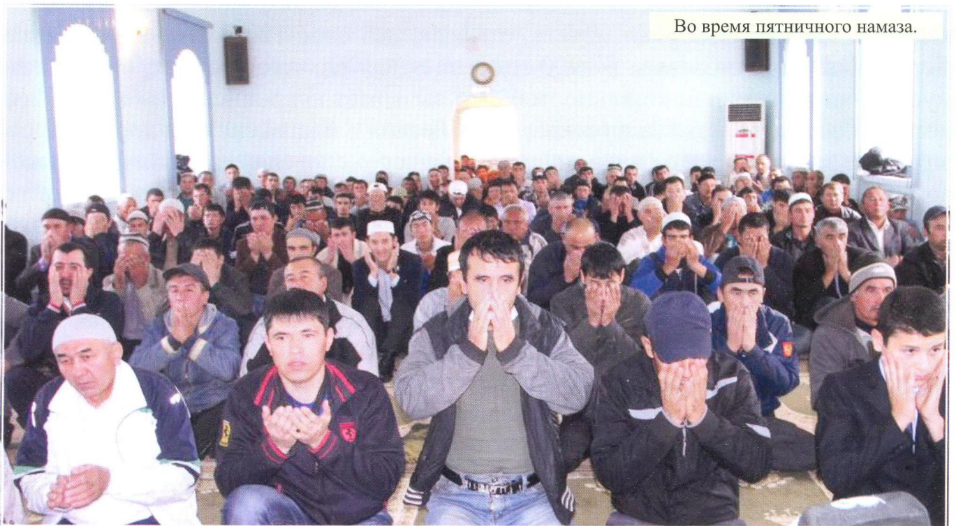
Во время пятничного намаза.

Верующие – это только те, которые уверовали в Аллаха и Его Посланника, а потом не испытывали сомнения и положили своё имущество и свою жизнь на пути Аллаха. Они-то и есть верующие. Посланник Аллаха (сав) сказал: «После смерти человека прекращается и запись всех его благих дел, кроме трёх: живая милостыня, полезное знание и благое дитя, поминающее его в молитве».