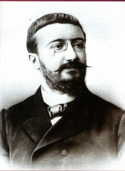
Альфред Бине, французский психолог, один из основателей тестологии.

Занимался проблемами патологии сознания, индивидуальных различий процессов памяти, графологии. Выводы большого графологического исследования, проводимого учеником с 1893 до 1907 года, изложены в его труде «Наука о будущем».