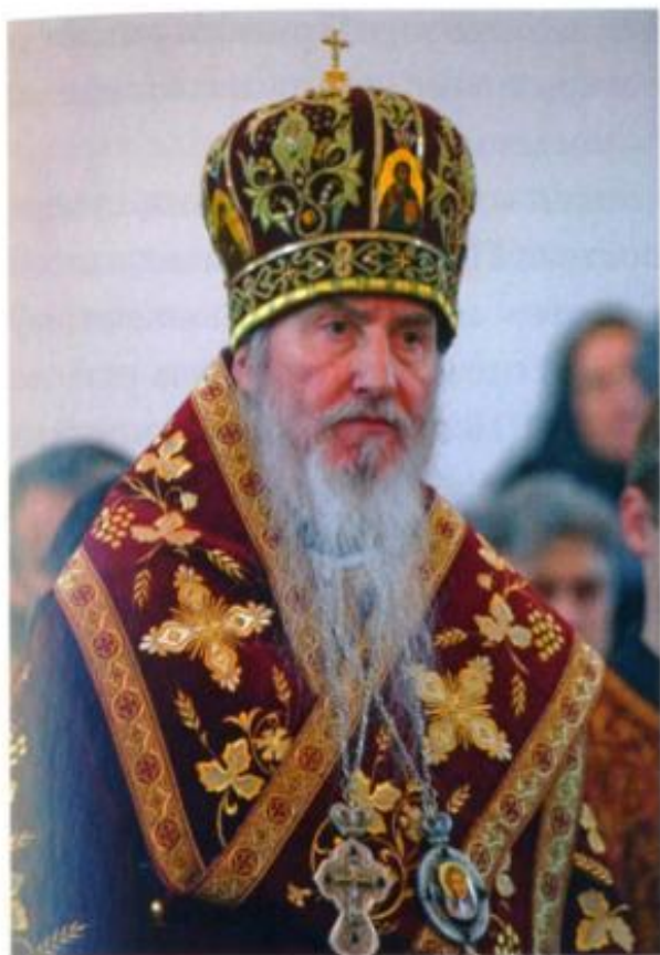
От Первого заместителя Председателя Архиерейского Синода Русской Православной Церкви Заграницей архиепископа Марка

О чём эта книга? Когда страх владел вселенной, когда война овладела всем, среди смертоносного мрака обрелись молодые души, верные свету Христову. Они верили: среди людей они не одни, свет Истины живет в сердцах людей. Сердца эти надо оживлять, воскрешать, звать к свету. Тогда, во обличение наглой лжи и трусливой лживости, как бритвой – диагноз: Антихрист .