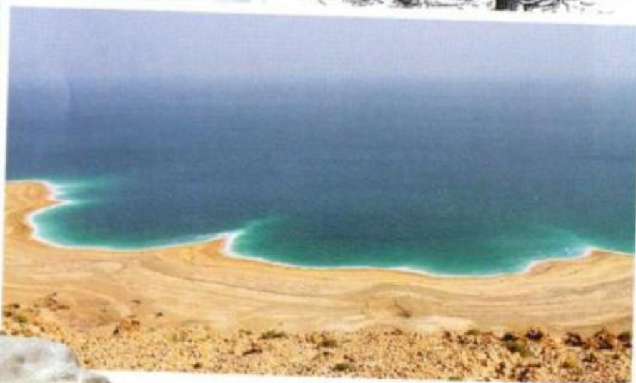
Мертвое море / The Dead Sea / Das Tote Meer