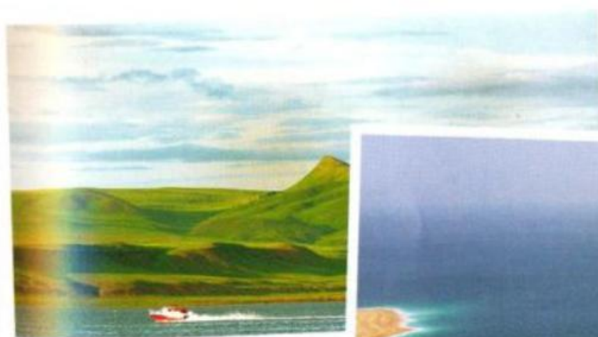
Озеро Шира / Lake Shira Schirasee in Chakassien (Russland)

Самое большое по площади соленое озеро России называется Чаны и находится в Новосибирской области. Его размер во время разлива достигает 2000 квадратных километров. Да вот беда – лечебной ценности вода этого озера не имеет. Напротив, соль озера Эльтон, расположенного на территории Волгоградской области, как бы углубляющейся в этом месте в Республику Казахстан, весьма целебна, как полезны для организма человека и иловые отложения этого водоема. Но расположение озера Эльтон диктует нам далекое путешествие. Многим россиянам потребуется потратить больше суток, чтобы добраться в эту пустынную местность с поистине инопланетным пейзажем. Точно так же вдали от городов и стратегических