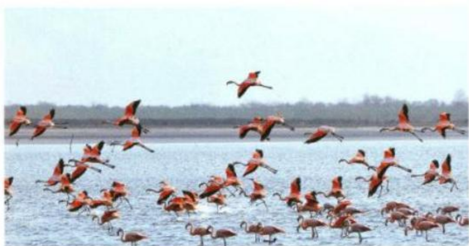
Озеро Мар-Чикита в Аргентине Lake Mar Chiquita in Argentine Die Laguna Mar Chiquita in Argentinien

Меж тем небольшие соленые озера Соль-Илецка, расположенные в 70 километрах южнее Оренбурга и всего в 30 километрах от северной границы Казахстана, лишь за три летних месяца собирают более миллиона приезжих!