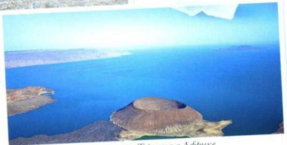
Содовое озеро Туркана в Африке Soda Lake Turkana in Africa / Turkanasee in Afrika