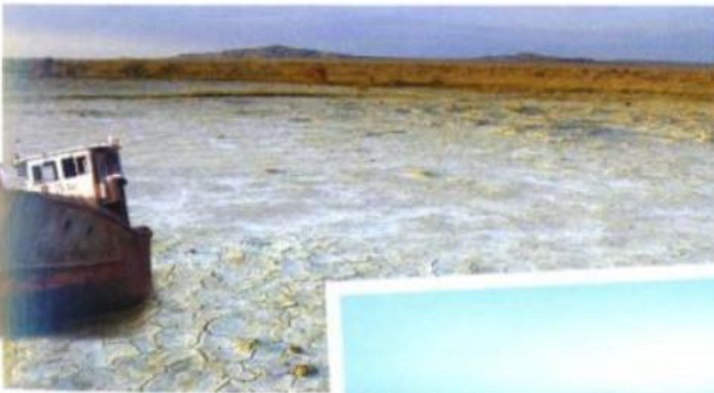
Аральское море The Aral Sea / Aralsee

Хотите еще уникальности? Пожалуйста: озеро Мар-Чикита в Аргентине. Вы знали, что птица соленых озер – розовый фламинго? Цвет его оперения напрямую связан с потребляемыми в пищу рачками и водорослями соленых водоемов. Так вот три из шести существующих видов розового фламинго живут на этом аргентинском озере. Фотографии австралийского озера Хиллиер часто попадают в подборки типа «10 самых удивительных мест на планете». Это связано с необычным розовым цветом его соленой воды. Озеро Шира