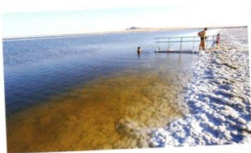
Озеро Баскунчак / Lake Baskunchak / Baskuntschak

Вот об этом, как и об удивительных лечебных свойствах местных грязей, о странном красноватом рачке артемия салина, великолепно чувствующем себя в концентрированном соляном рас-