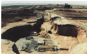
Рис. 7. Могильник Филитовка 1, курган 4, погребение 5: погребальная камера

находок — предметов вооружения и украшений, выполненных в традициях скифо-сибирского звериного стиля. Некоторые из них имеют близкие аналоги в памятниках ахемендского 1 культурного круга, скифских памятников Северного Причерноморья и меотских Северного Предкавказья.