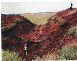
Рис. 5. Могильник Филипповка 1, курган 4: грабительская траншея

исследовано еще 12 курганов могильника, включая «царский» курган (№ 4) высотой около 8 м и диаметром свыше 80 м (Рис. 3). Раскапывать царский курган — это задача не простая и огромная ответственность для археолога. Несмотря на то что уже размеры кургана сулили находки новых сокровищ, мы долго не решались приступить к его исследованию. Заставила беда: весной 2005 г. этот курган подвергся попытке ограбления (Рис. 4). В поисках золота грабители-вандалы использовали экскаватор, которым они разрушили значительную часть насыпи кургана, деревянное перекрытие могилы и добрались до самого захоронения (Рис. 5). Казалось, уже нет надежды обнаружить в кургане нетронутые археологические комплексы. Тем не менее в 2006 г. работы были начаты. Задача была исключительно сложной — грандиозный памятник нужно было исследовать за один летний сезон (от силы три месяца). В противном случае существовал огромный риск, что грабители вернутся на недокопанный археологами курганам и продолжат там свое черное дело. В таком случае мы бы только облегчили им задачу.