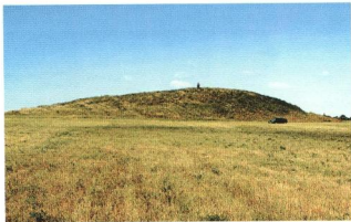
Рис. 3. Могильник Филипповка 1, курган 4 до ограбления