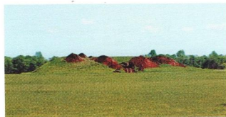
Рис. 4. Могильник Филипповка 1, курган 4 после ограбления

исследовано еще 12 курганов могильника, включая «царский» курган (№ 4) высотой около 8 м и диаметром свыше 80 м (Рис. 3). Раскапывать царский курган — это задача не простая и огромная ответственность для археолога. Несмотря на то что уже размеры кургана сулили находки новых сокровищ, мы долго не решались приступить к его исследованию. Заставила беда: весной 2005 г. этот курган подвергся попытке ограбления (Рис. 4). В поисках золота грабители-вандалы использовали экскаватор, которым они разрушили значительную часть насыпи кургана, деревянное перекрытие могилы и добрались до самого захоронения (Рис. 5). Казалось, уже нет надежды обнаружить в кургане нетронутые археологические комплексы. Тем не менее в 2006 г. работы были начаты. Задача была исключительно сложной — грандиозный памятник нужно было исследовать за один летний сезон (от силы три месяца). В противном случае существовал огромный риск, что грабители вернутся на недокопанный археологами курганам и продолжат там свое черное дело. В таком случае мы бы только облегчили им задачу.