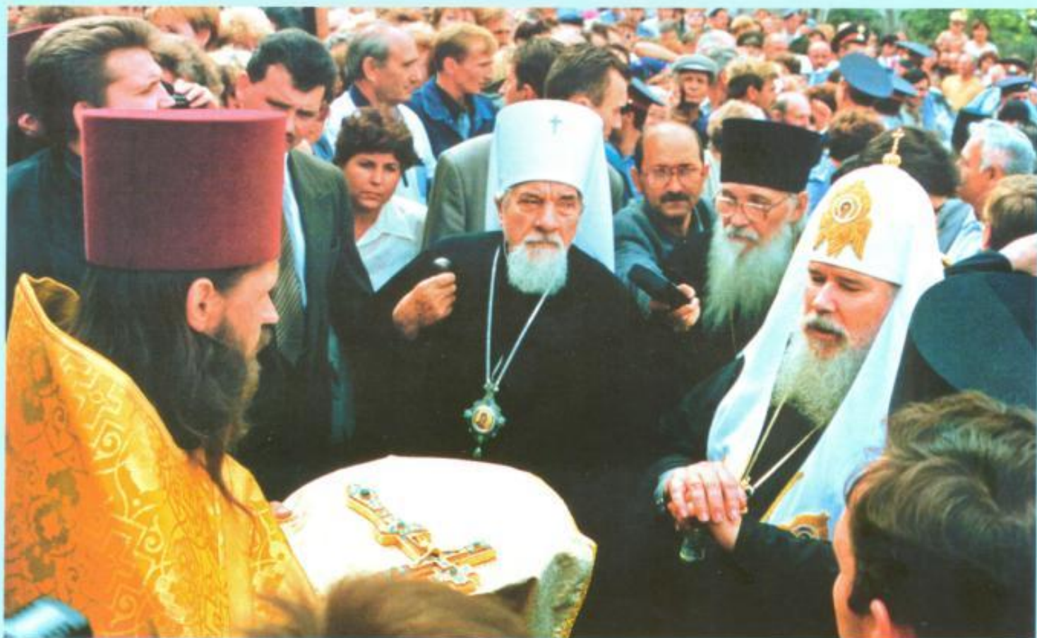
Святейший Патриарх Алексий II и митрополит Леонтий в Обители Милосердия