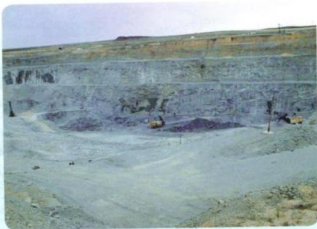
Карьер месторождения «Осеннее»