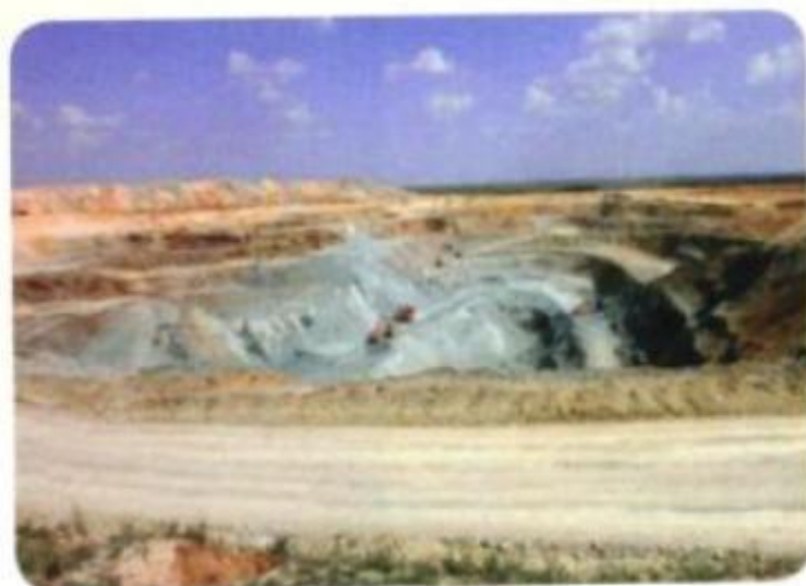
Карьер месторождения «Левобережное»