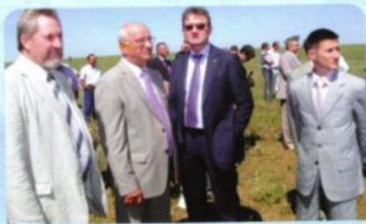
Открытие карьера «Осеннее»