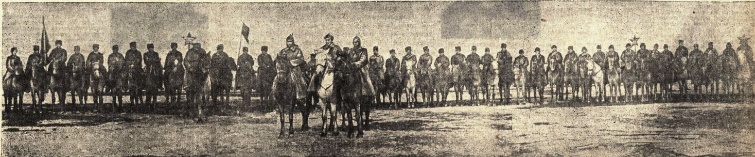
КАЗАЧЬЯ СОТНЯ, САРАКТАТСКОГО РАЙОНА, ПРИБЫВШАЯ В ОРЕНБУРГ ПРИВЕТСТВОВАТЬ 1-ю ОБЛАСТНУЮ ПАРТИЙНУЮ КОНФЕРЕНЦИЮ.

После митинга начинается парад. Перед трибуной, которая устроена на двух грузовиках, проезжают на танцующих конях казачьи сотни. Проходят части оренбургского гарнизона, идут осовиниченным и затем несомкемые колонны рабочих и служащих Оренбурга. Парад принимает президиум конференции, а с другой стороны этот парад принимают и красные казаки, которые после того, как они прошли перед трибуной, выстроились в одну шеренгу вдоль Советской улицы.